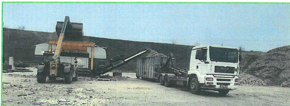
Operáció munka közben