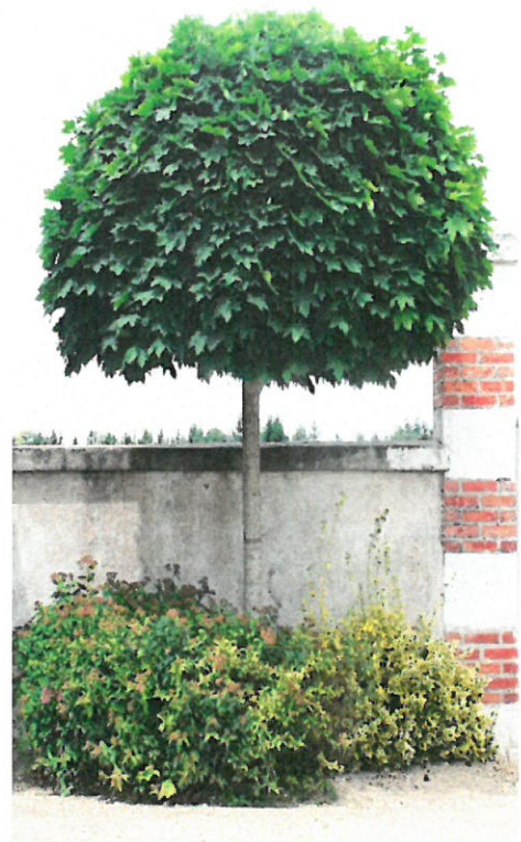
3. ábra Gömb juhar