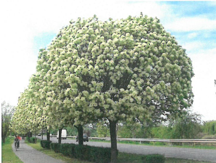
2. ábra Gömb kőris