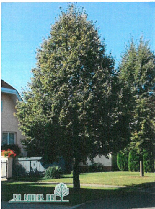
1. ábra Kislevelű hárs