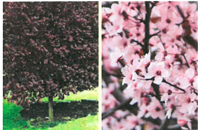
4. ábra Vérszilvafa