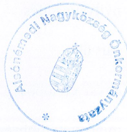
dr. Tüske Zoltán polgármester