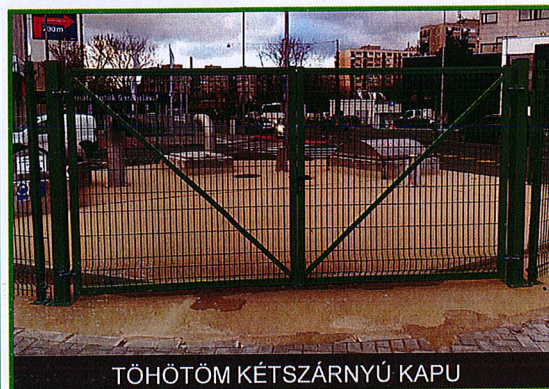
TŐHÖTÖM KÉTSZÁRNYÚ KAPU

A tér bekerítése önmagában nem oldja meg a felmerült problémákat, ezért az elvárásoknak megfelelő üzemeltetéshez a fenti költségen túl szükséges 2 fő „gondnok” alkalmazása is.