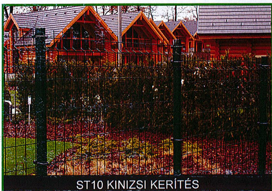
ST10 KINIZSI KERÍTÉS