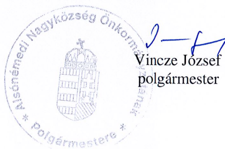
Vincze József polgármester