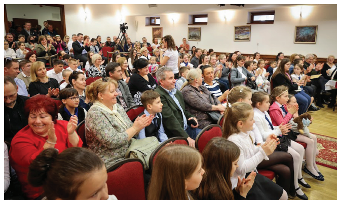
Zsúfolásig megtelt a színházterem