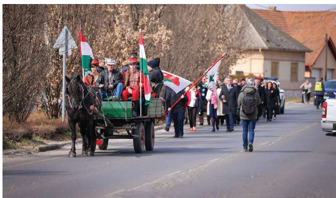
Útban az ünnepségre