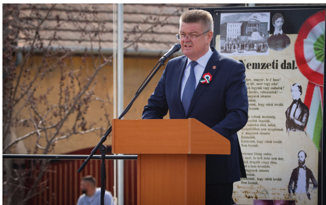
Dr. Tüske Zoltán polgármester ünnepi beszéde