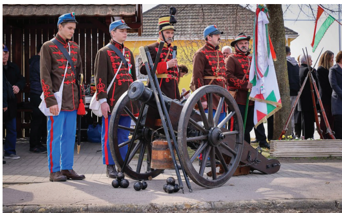
Dabasi Honvédtüzér Egyesület