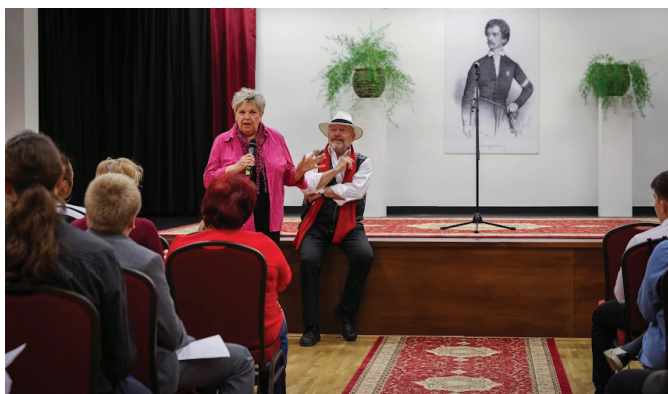
A zsűrielnökök: Döbrentey Ildikó és Levente Péter