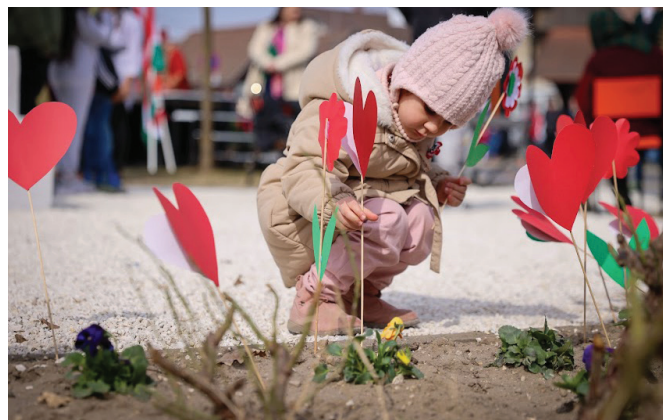
A legkisebbek is ünnepelnek