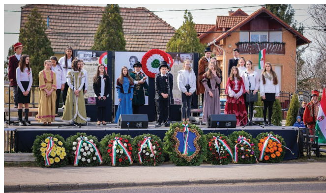
A 7. osztályosok ünnepi műsora