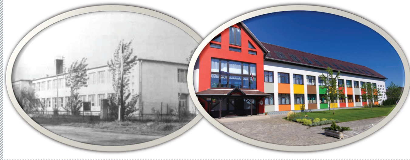
Széchenyi István Általános Iskola

Az Alsónémedi Széchenyi István Általános Iskola épülete 2021-ben 50. születésnapját ünnepli. Öt évtizede, immár a harmadik nemzedék gyermekei tekintik második otthonuknak a folyamatosan bővülő, egyre nagyobb és látványosabb épületet. Köszönjük mindenkinek, aki hozzájárult az intézmény fejlődéséhez. Mindannyian büszkék vagyunk arra, hogy most egy XXI. századi, modern létesítményben tanulhatnak gyermekeink. A születésnap méltó módon való megünneplését a veszélyhelyzet utánra tervezzük.