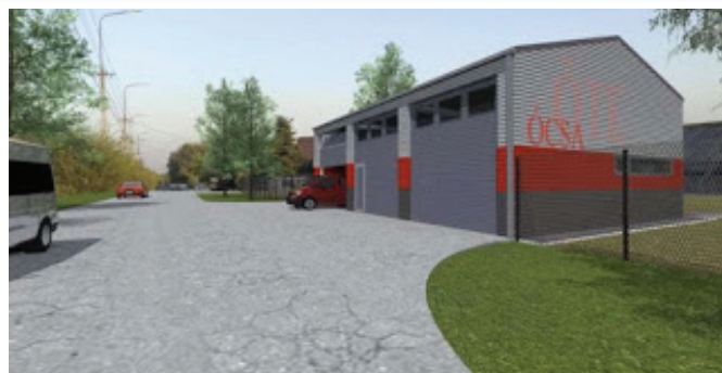
Ócsai Önkéntes Tűzoltó Egyesület tervezett épülete (látványterv)

Az Ócsa Önkéntes Tűzoltó Egyesület részére 2020. évben nyújtott 850 000 Ft felhalmozási célú támogatás felhasználási és elszámolási határidejét az Egyesület