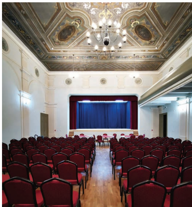
Nagyajta – kultúrotthon

Az iskola étkező bővítési, udvari kerékpártároló, térburkolat és kerítés építési fejlesztéshez kapcsolódó tervezetési feladatok elvégzésével a Farkas Építésziroda Kft-t (6000 Kecskemét, Nagykőrösi u.37., adószám: 10434206-2-03) bízta meg a Polgármester. A tervezési feladatok elvégzésének díját 1.206.500,- Ft bruttó .