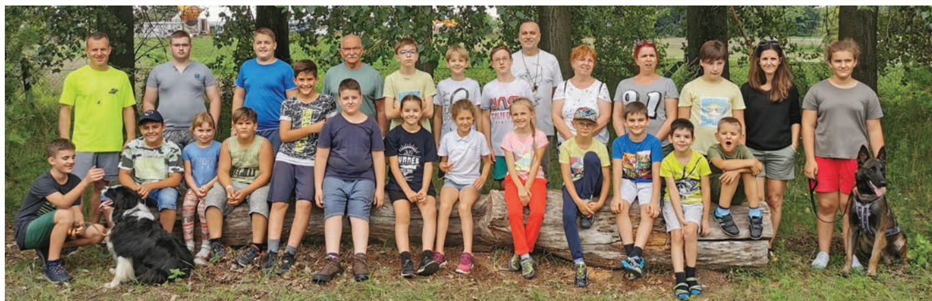
A NYWYG Íjász és Hagyományőrző Egyesület hírei: