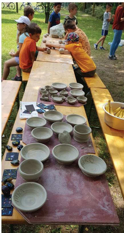
Kézműves foglalkozás a Szent István téren