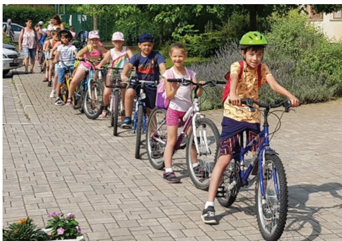
Indul a kerékpártúra!