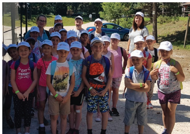
Íme, itt van a nagy csapat!