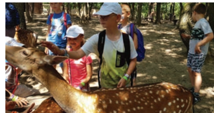
Állatsimogatás a budakeszi Vadasparkban