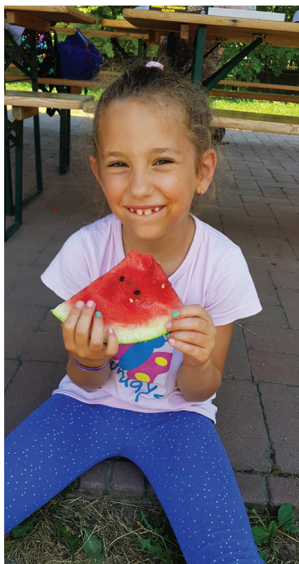
Köszönjük az ajándékba kapott dinnyét!