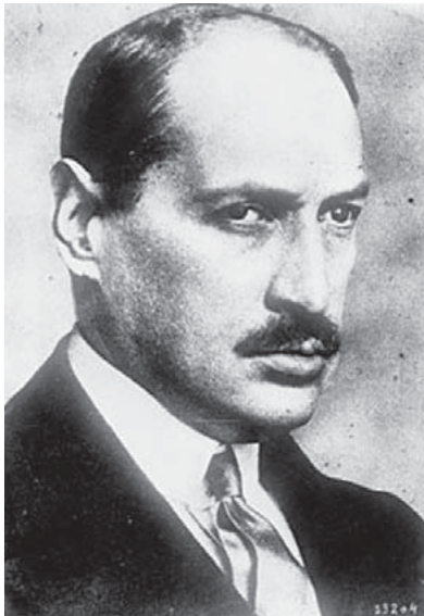
gróf Károlyi Mihály

A nagy háborút elvesztettük. A magyar állam gépezetén ijeszítően kezdtek lazulni a csavarok, s ebben az óráról órára növekvő zűrzavarban, a balsors e dermesztő napjaiban a magyarságot olyan vezetővel, gróf Károlyi Mihállal, verte meg a forradalom kiszámíthatatlan és felelőtlen szeszélye, akinek tehetségtelenségénél csak elbizakodottsága,