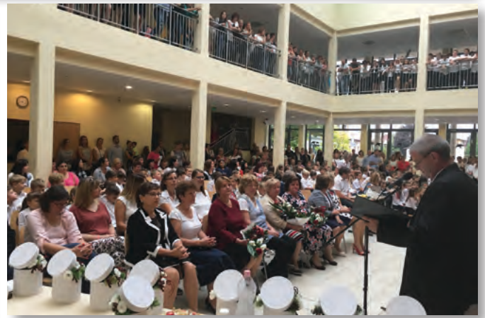
Nyugdíjba vonuló pedagógusaink