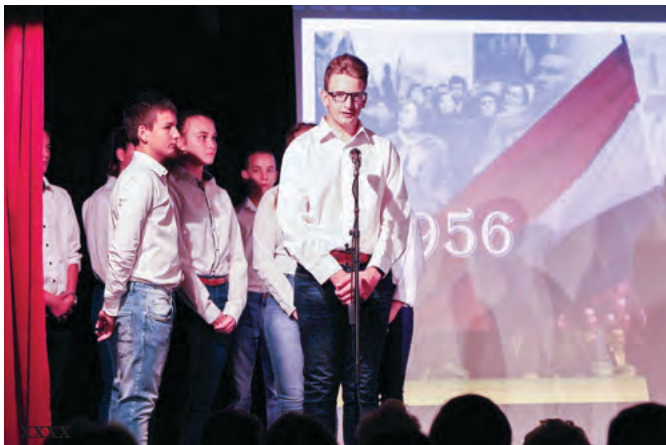
Községi ünnepen szereplő tanulóink