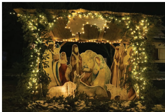
Alsónémedi, Szabadság tér 2019. Advent első vasárnapján