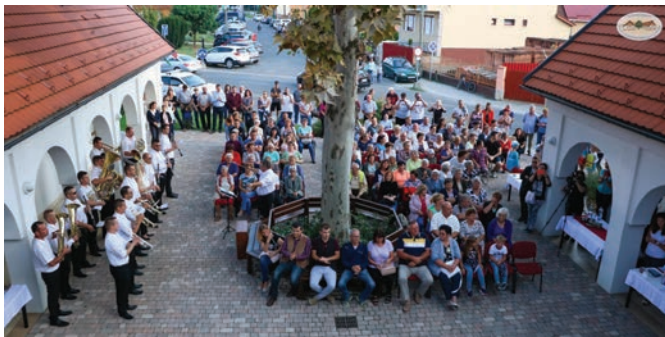
Térzene a platánfa körül