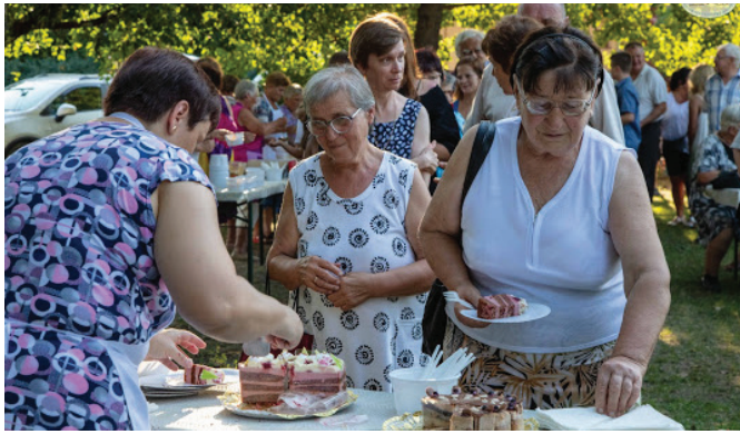
Szent István tér, augusztus 20. Megkóstoljuk az ország tortáját