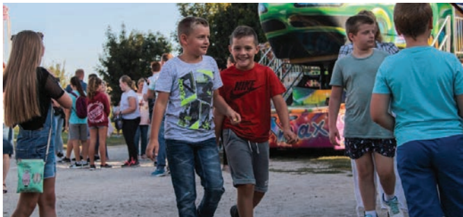
„Gyüvőnyári” legények a Búcsúban