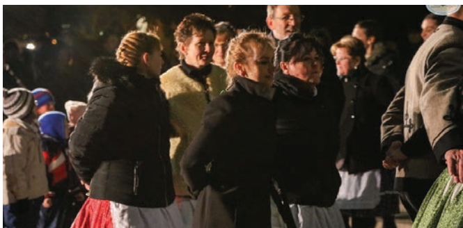
Táncsal köszöntjük Advent első napját