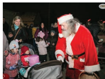
Megjött Némedire a Mikulás