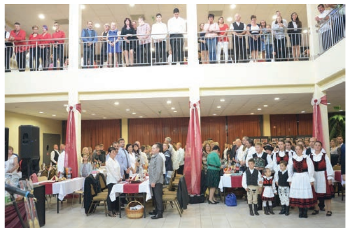
Határok nélkül székelyek és magyarok