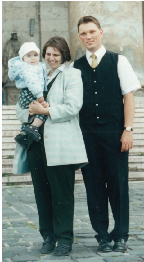
Ideérkezésünk 20 évvel ezelőtt