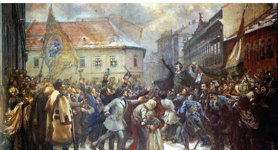
Petőfi Sándor lelkesítő szöveget intéz a néphez