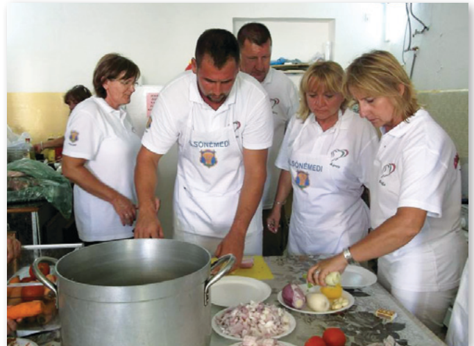
Készül a gulyásleves

zetek közötti kulturális együttműködést. Délután Mdina ódon, szűk utcáit, középkori és barokk építészeti remekait tekinthettük meg.