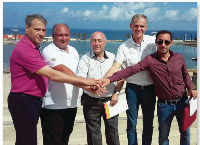
Az öt polgármester

ról, fejlesztésekről és fejlődési lehetőségekről, amelyekkel mindegyik település szembenéz. A prezentációk közötti szünetekben pedig lehetőségünk nyílt személyesen is beszélgetni ezekről a témákról a többi nemzet képviselőivel. Egy állatkerti látogatás után megtekintettük a helyi iskolát és a helyi tanács épületét is. Majd délután a művelődési házban készülni kezdtünk a kulturális estre. Ez az alkalom további lehetőséget adott egymás hagyományainak, gasztronómiájának megismerésére. Mindegyik település egy-egy asztalt kapott, a sajátunkat megterítettük Magyarországra jellemző tárgyakkal, ételekkel (pap-