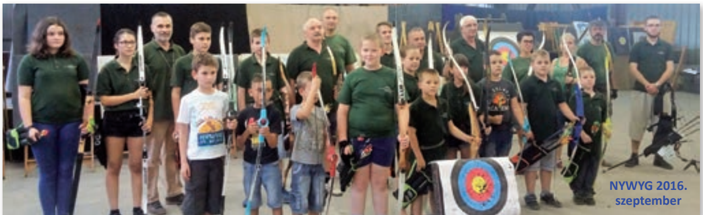
NYWYG 2016. szeptember

Az edzéseket a Schuller Csarnokban tartjuk!