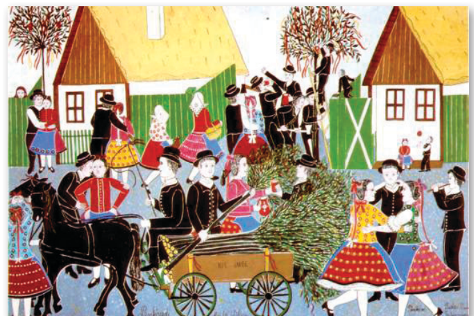
Festette: Vankóné Dudás Juli