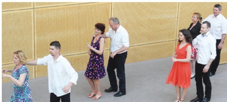
Topeka Tangó felnőtt csoport