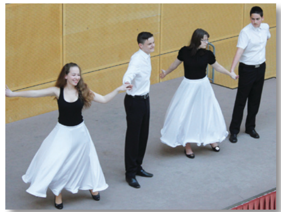
Topeka tangó Ifjúsági csoport