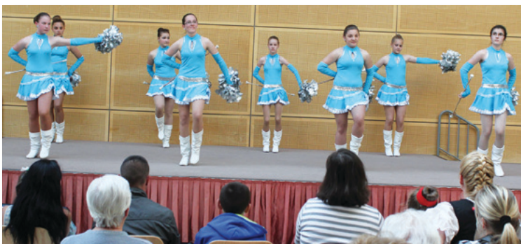
Napfény Mazsorett felsősök