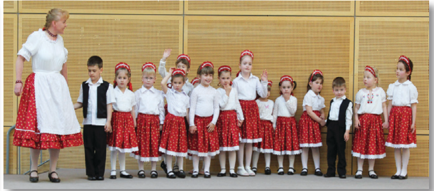
Cseppek a Rákóczi u.-i óvodából