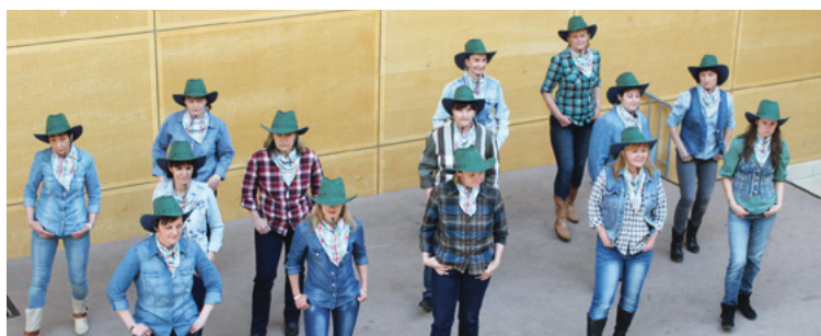
Óvónők country bemutatója