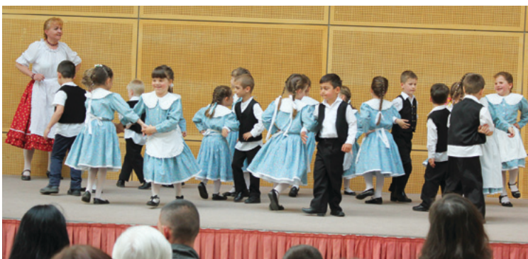
Cseppek a Szent István téri óvodából