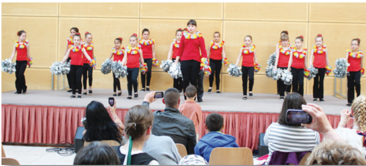
Napfény Mazsorett alsósök