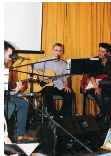
A fiatalok Költészet Napján bemutatott irodalmi összeállítás