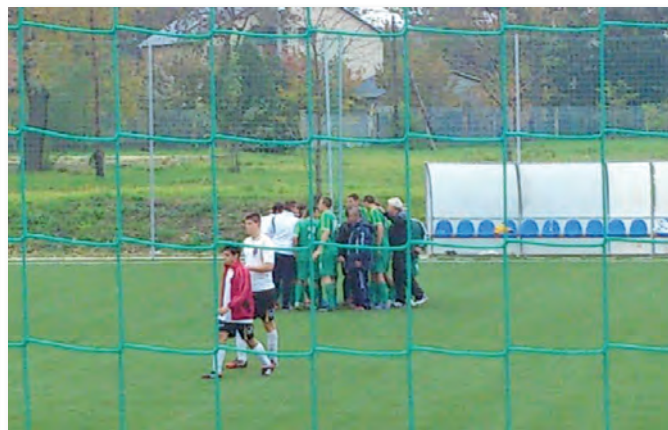
Bajnoki mérkőzés U21 Ikarusz- ASE 0:2, az Első elleni győzelem, átlagon felüli teljesítménnyel.