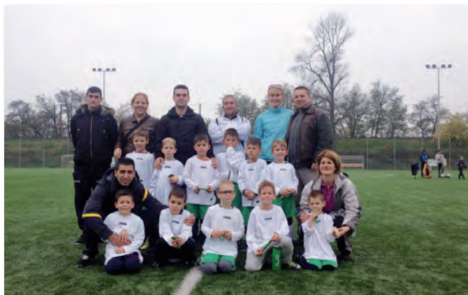
U6-U7 Bozsik Torna (fesztivál)