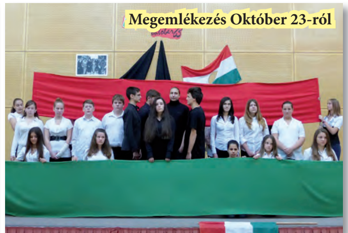
Megemlékezés Október 23-ról