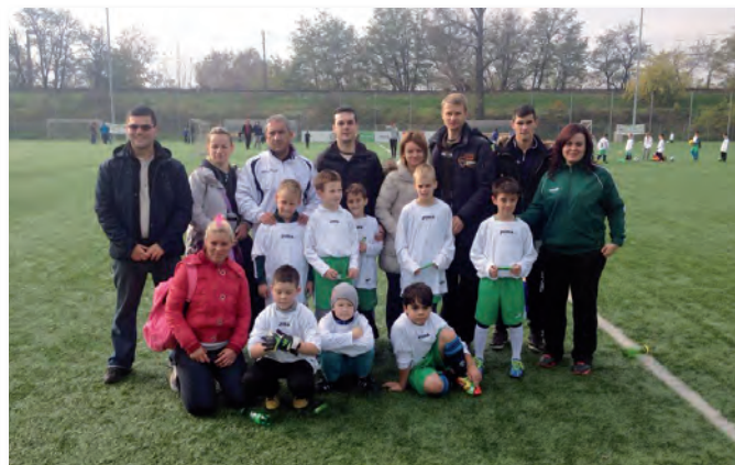
U8-U9 Bozsik Torna ( fesztivál)