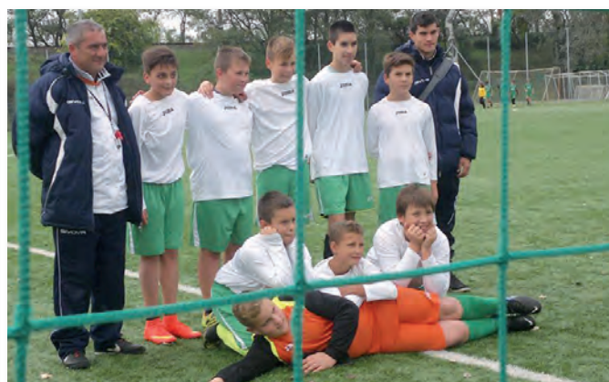
U12-U13 Bozsik Torna