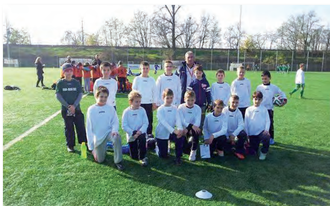
U10-U11 Bozsik Torna