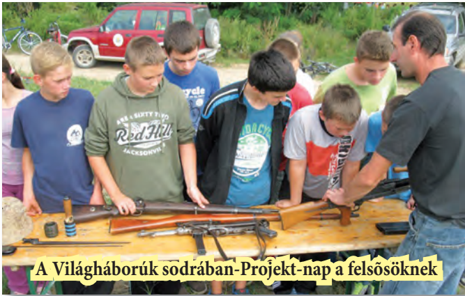
A Világháborúk sodrában-Projekt-nap a felsősöknek