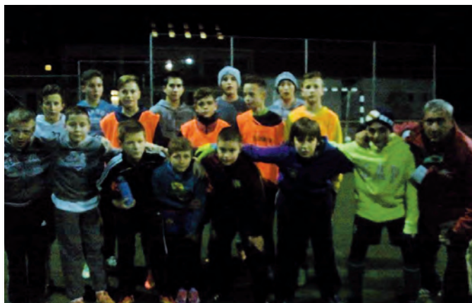
U14 Egy jó hangulatú edzés után