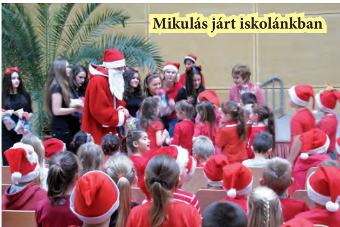
Mikulás járt iskolánkban