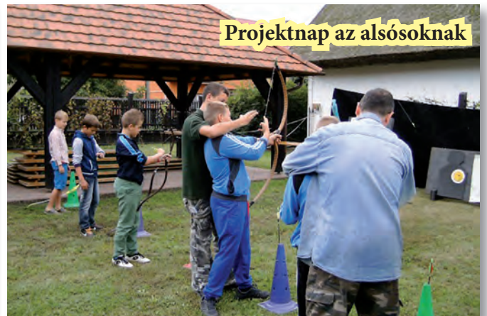
Projekt nap az alsósoknak