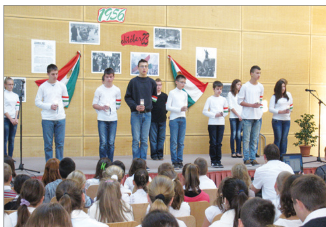
Az 56-os forradalomra emléztünk