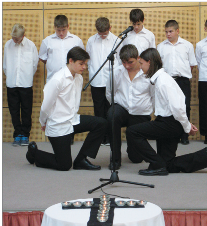
Október 6. az aradi vértanúk emléknapja