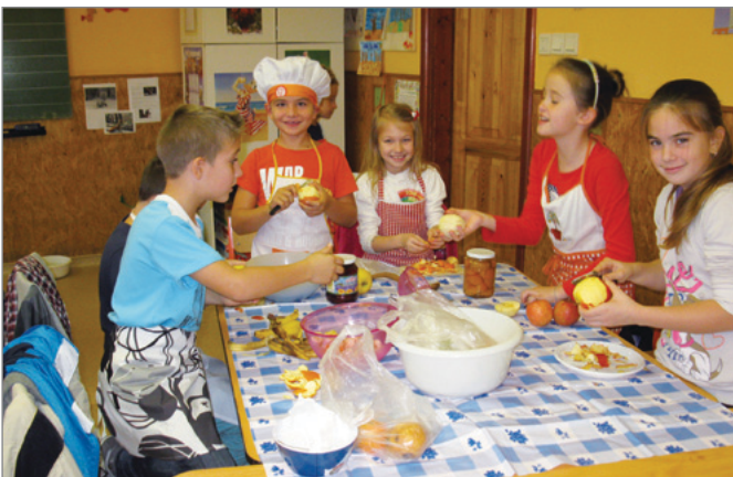
Egészségnap - gyümölcssaláta készítés