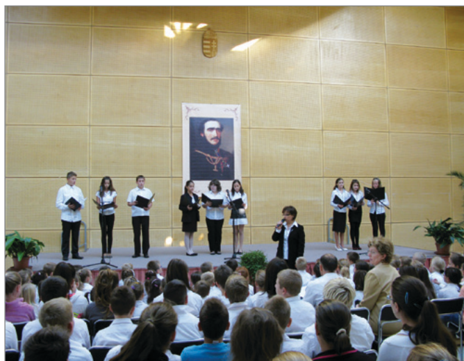
Megemlékezés Széchenyi István születésnapjáról