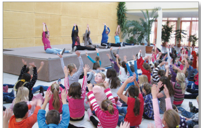
Egészségnap - reggeli torna