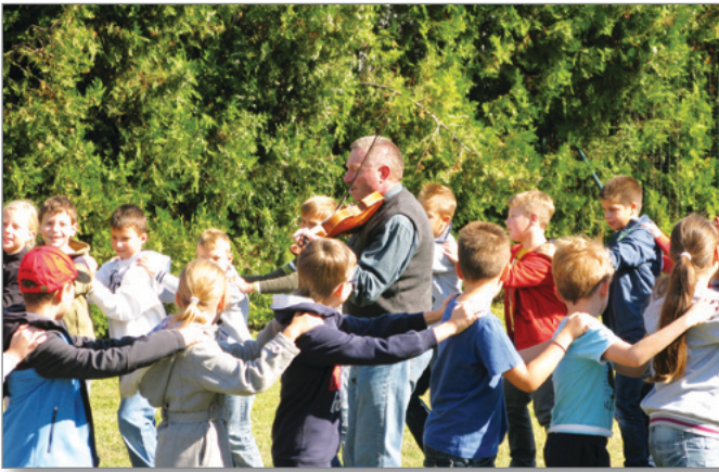
Falunapok - tánc- és daltanulás