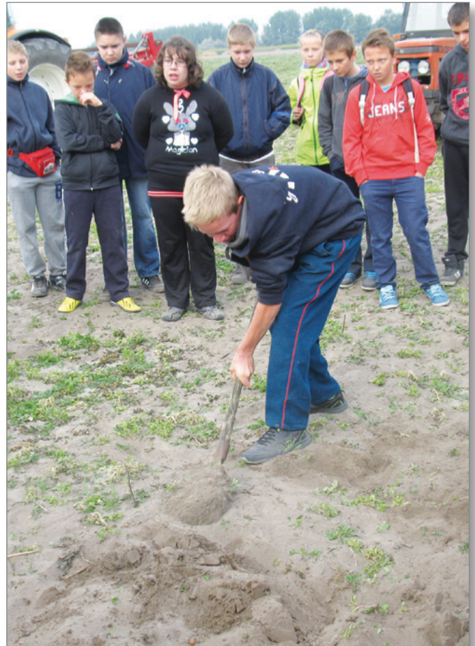
Hagyomány-Mentés-Másként - ásás