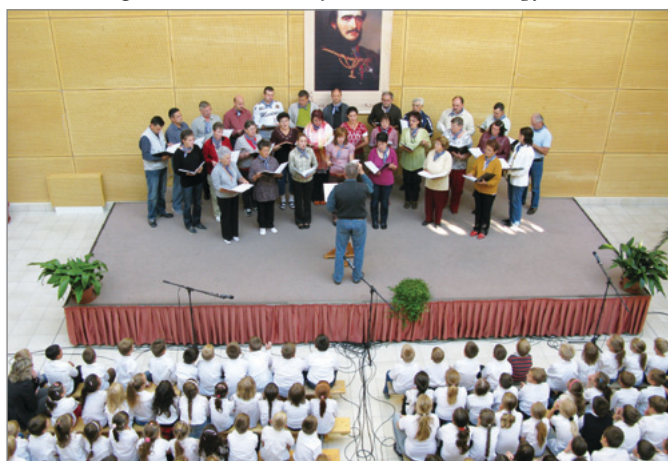
Falunapok - bemutatkozik a nagyjaiti dalárda