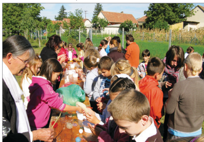
Falunapok - kézműves foglalkozás