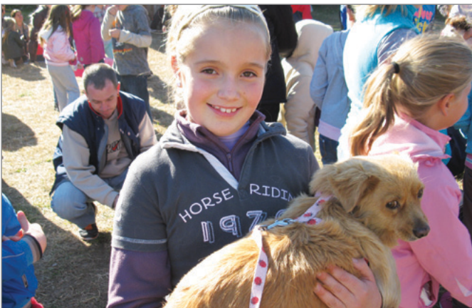
Állatok Világnapja - kedvenc állatom