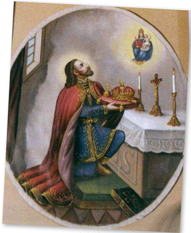
Szent István Szűz Mária oltalmába ajánlja Magyarországot

Talán a leggyakrabban felbukkanó vád a Koppány vezér elleni harc (a levirátus figyelmen kívül hagyása) és Koppány felnagyítása. Gyorsan szögezzük le, az adott korban a büntetés e ma kegyetlennek tűnő módja teljesen természetes gyakorlat volt. István vagy Koppány? Véleményem szerint több mint ezer év távlatából mindkét történelmi nagyságunkat tisztelni kell. Koppány a magyar vitézség, büszkeség, a múlthoz való ragaszkodás, a hagyományörzés megtestesítője. Míg István király a haladás újszerű, bátor vállalója. Kettőjük közül egyiküknek