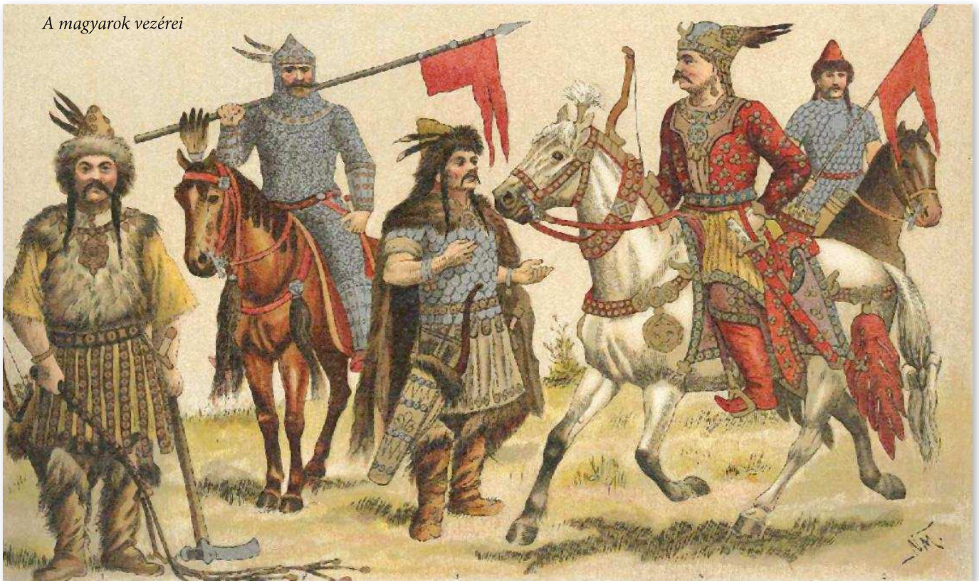
A magyarok vezérei

ság néven egy új államalakulat lép a nemzetközi politikai élet színterére. Ez az a történelmi pillanat, amikor a magyar katonai fölény még megingathatatlanak látszik. Igaz, egy aprócska porszem kerül a gépezetbe, 933-ban egy fáradt, elcsigázott, zsákmánnyal gazdagon megrakott, és elbizakodott magyar haderőre mérnek vereséget Merseburgnál a németek.