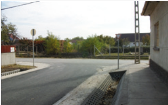
Elsőbbségadás kötelező a Rákóczi utcára hajtóknak!