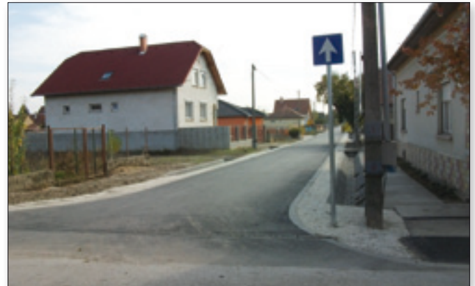
A Hunyadi utca felől egyirányú