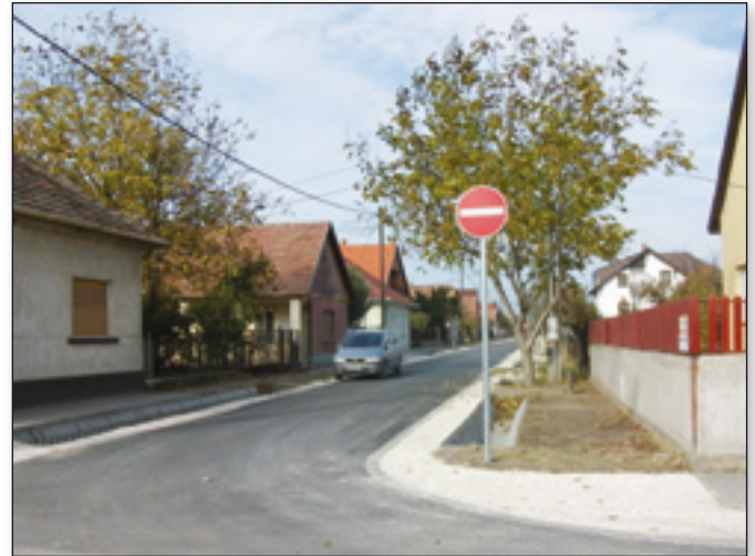
A Rákóczi utca felől behajtani tilos!