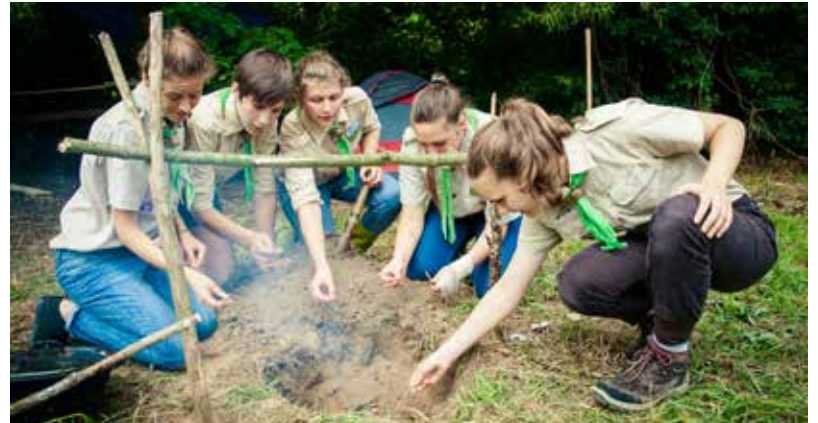
Semmi nem helyettesítheti a tábortűz hangulatát

És ekkor szokott az is előfordulni, hogy hazaérkezéskor a szülő megrökö-