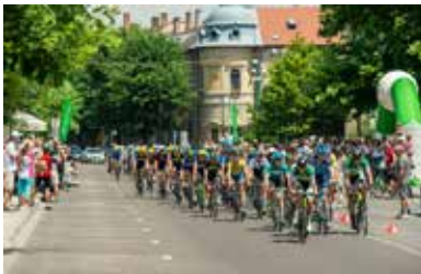
Cegléd rajt- és célállomás lesz

A cikk teljes terjedelmében a www.pestmegyelapja.hu oldalon olvasható.