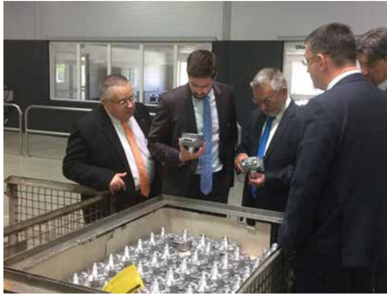
Az Ecséri Alumínium Öntöde Kft. gyártócsarnokának ünnepélyes átadásán

„Ez a kormány végre szakított Magyarországot Budapest-központúságával, és miközben odafigyel a főváros fejlesztésére, érdemi forrásokat biztosít