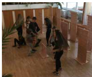
A színtanodával a szereplésből adódó gátlások csökkentését szeretnék elérni

A gyerekek bevonását szolgálja a színtanoda is – hívta fel a figyelmet a színművész –, a kisebbek szombatokonként ismerkedhetnek a színészmesterség alapjaival, ugyanakkor „mi nem színészeket akarunk képezni, hanem egyfajta nyitottságot, a szereplésből adódó gátlások csökkentését szeretnénk elérni”. Persze néhány év múlva a tehetséges diákok akár színpadra is léphetnek, és