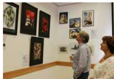
Dunakeszi mutatkozik be elsőként

A dunakeszi művészek munkái június végéig láthatóak a pesti Megyeháza épületében, majd az egyes járasok tehetséges művészeinek alkotásait bemutató kiállításorozat az érdi és nagykörösi alkotók bemutatkozásával folytatódik. ❖