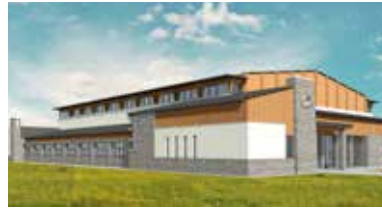
A sportsarnok látványterve

– Várjuk azt a kormányzati döntést, amelynek értelmében egy új, tíz tan-