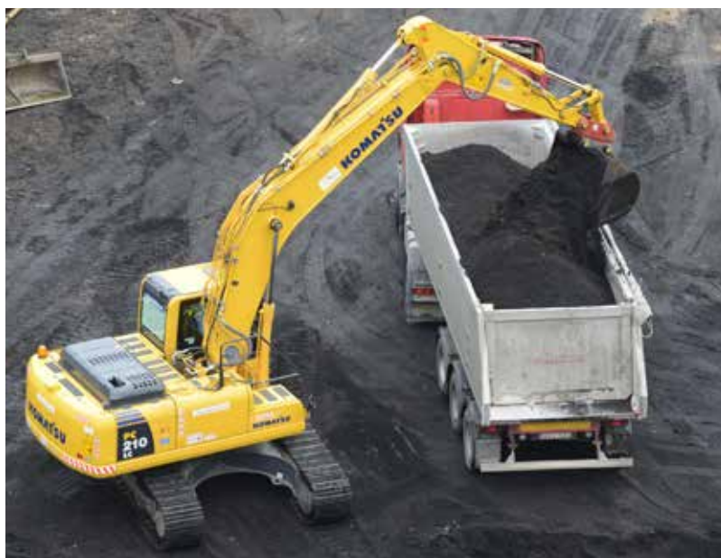
Megkezdődött a várva várt M4-es autópálya építése, zajlanak a Cegléd–Albertirsa szakasz közötti földmunkálatok

– Ezen a területen természetesen a főváros közelsége, elérhetősége fontos szempont, hiszen sokan ott tanulnak, dolgoznak, szórakoznak és művelődnek. Ezt mi, Pest megye ügyének kormánypárti előremozdítóit nem bajként, hanem kiaknázandó lehetőségként értékeljük. Ugyanakkor építeni szeretnénk mindarra, amit mi tudunk nyújtani. Hiszen nem csupán Budapest érhető el gyorsan a mi vidékünkön, hanem a mi településeink és tájaink is a fővárosból. Természeti kincseink, csendes és szép zugaink, barátságos településeink, jó éttermeink, igényes szállásaink vannak: mind-mind kiváló lehetőség, amit okos fejlesztésekkel kell kihasználni az itt élők és vállalkozók boldogulására. A válság elmúltával megállni látszik az elköltözés folyamata is. Újra sokan választják a vidék nyugalmát, és ezzel nem alkalmi, hanem tartós vásárlóerőt hoznak. Ez is jó esély a további fejlesztésekre. ❖