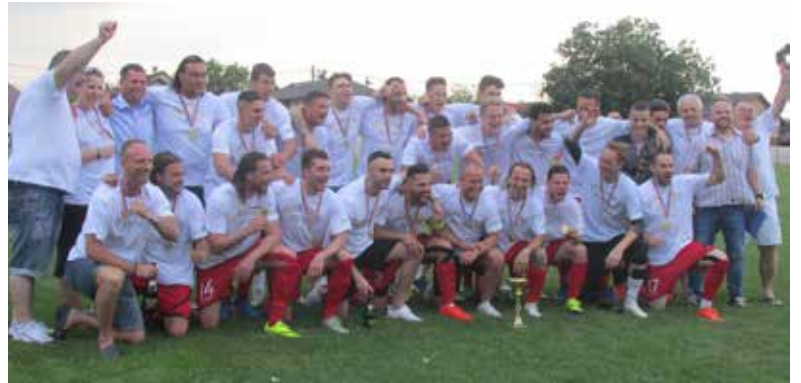
A játékosok közül többen élvonalbeli múlttal rendelkeznek

„A Vecsés négy éve próbálkozik a feljutással, kétszer másodikként, egyszer harmadikként végzett, mielőtt most sikerült megnyernie a bajnokságot. A város a polgármesterrel az élen abszolút a klub mögött áll. Próbáltuk úgy összeállítani a keretet, hogy alkalmas legyen a feljutásra. Ugyanakkor három kulcsjátékosunk: