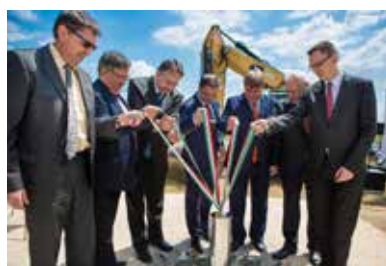
Az M2-es új szakaszának alapkötetelése

teremt Budapest irányába. Sződligeten és Dunakeszi északi részénél új külön szintű csomópontokat alakítanak ki, megújul 14 híd, valamint 6 új híd is épül. A zajhatás csökkentésének érdekében összesen 2,8 km hosszúságban zajárnyékoló fal épül. A beruházásban a már jelenleg is négysávos szakaszokat is felújítják. ✦