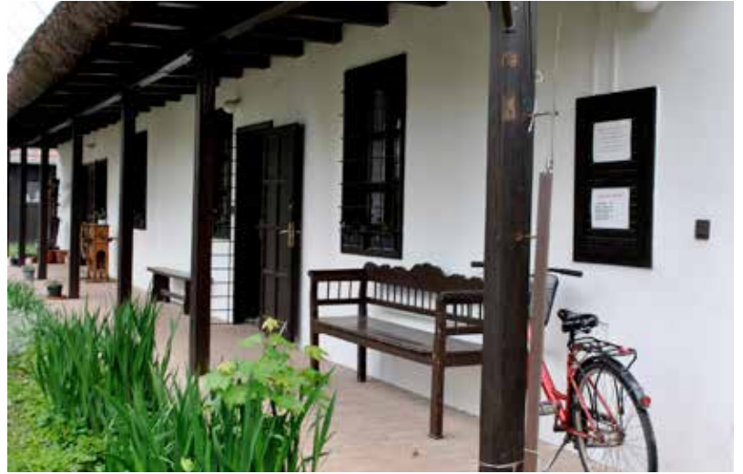
A tájház folyamatosan gyarapodó tudástár és tárgygyűjtemény, de oktatási hely is

– Egy település irányítói nem szakadhatnak el az ott élőkől, nem keletkezhet úr a település vezetése és a lakosság között. Ha nincs egyetértés, meg kell beszélni a község lakóival. És meg lehet