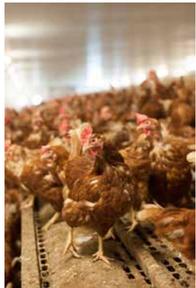
312 ezer gazdaság foglalkozik baromfineveléssel

A mai értelemben vett baromfitenyésztés – a pecsenyecsirke- és tyúktójas-előállítás nagyüzemi módszereinek meghonosítása – az 1930-as években az Egyesült Államokban kezdődött, de igazán tömegessé a hatvanas évektől vált a termelés. A múlt század utolsó harmadában az összes kontinens számos országában létrejöttek azok a komplex feltételek (a takarmánytermesztéstől az állategészségügyi háttérrel át a műszaki